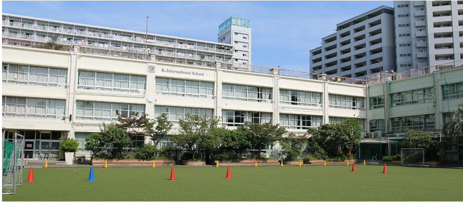
学校風景：2020年に建替えが予定されている旧校舎とグラウンド

学校法人ケイ・インターナショナルスクール東京（以下、KIST）では教室設置の生徒用 PC と教職員用 PC の運用管理に悩みを抱えていた。